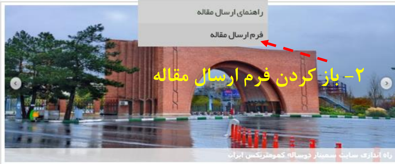
راه اندازی سایت سمینار دوساله کمومتریکس ایران